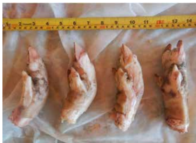
Figura 03 - Caso 3, fotos de partes de animais avaliados.