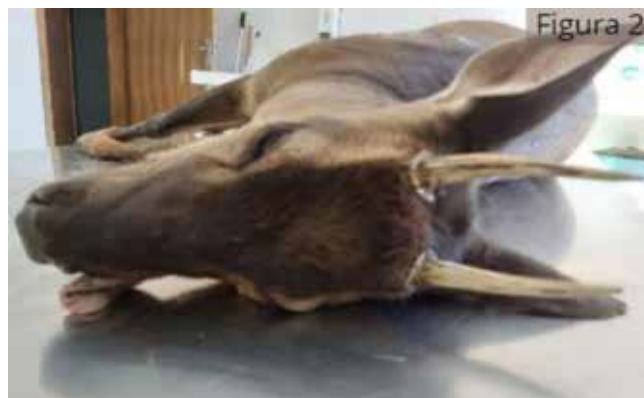
Figura 02 - Formato e coloração da cabeça, cornos, orelhas e focinho.

O cadáver apresentava sinais de ferimento perfurocontuso ocasionado por projétil de arma de fogo (PAF) na região escapular em membro anterior direito (Figura 1), caracterizado pela presença de lesão circular com bordas projetando-se para o interior indicando área de entrada do projétil com impressão de halo de tatuagem correspondente a tiro à “queima roupa” (figura 3), não sendo observado área de saída.