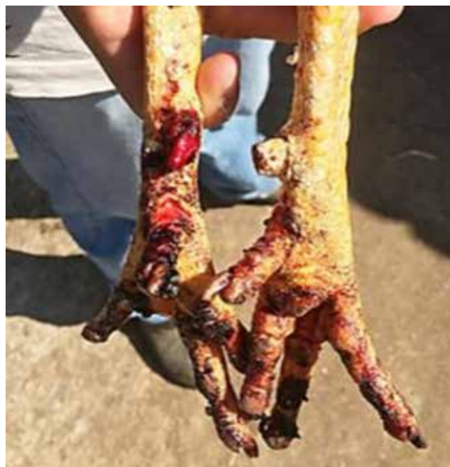
Figura 02 - Lesões de esfolamento nos pés e esporas aparadas.