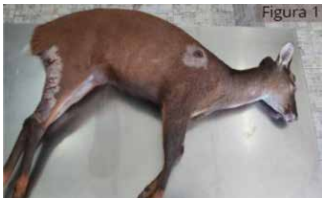
Figura 01 - Características da espécie: coloração de pelos e cascos. Localização da entrada do projétil em região escapular de membro anterior direito (A).