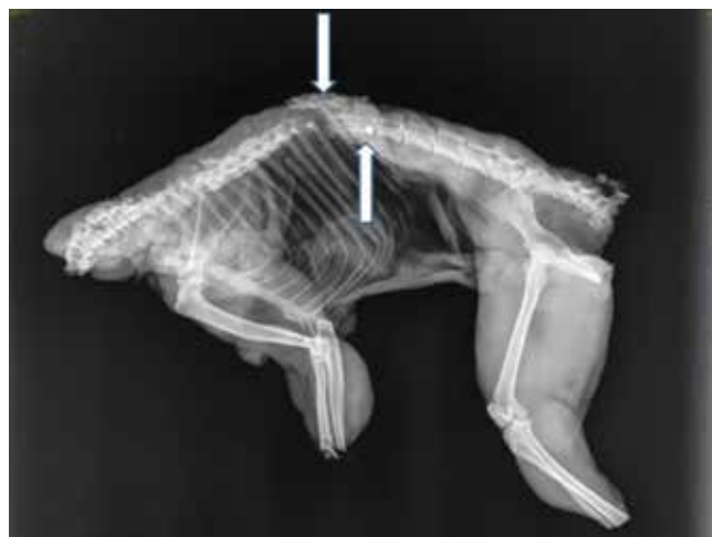
Figura 02 - Lesão traumática entre T17 e T18 (↓); Presença de grão de chumbo em T19 (↑).

No exame radiográfico observou-se lesão traumática entre a 17ª e a 18ª vértebras torácicas descrita por fratura completa e ruptura medular, caracterizando agressividade na captura do animal, crime passível de punição com reclusão de um a três anos e multa, como previsto na Lei de Proteção à Fauna - Arts. 1º e 27º da Lei n. 5.197, de 3 de janeiro de 1967 que proíbe utilização, perseguição, destruição, caça ou apanha de quaisquer espécies da fauna silvestre. (3)