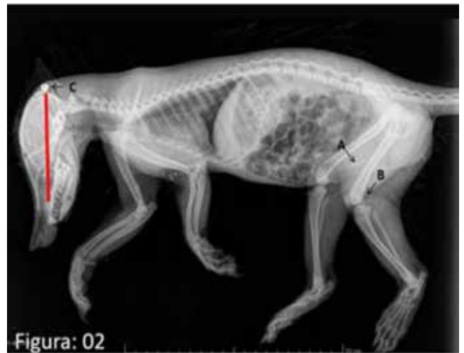
Figura 02 - Osso peniano em formação (A), disco de crescimento na epífise distal do fêmur (B) Identificação de projétil em crista occipital (C) em vermelho é possível identificar a trajetória do projétil.