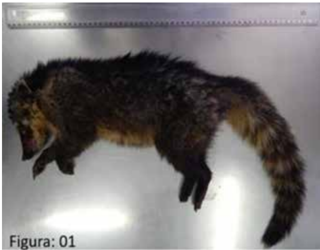
Figura 01 - Características morfológicas associadas a coloração, formato de cabeça e anexos, patas e cauda.

A radiografia constatou a presença de um projétil alojado na região parietal direita e estilhaços que comprometeram as estruturas encefálicas, confirmando-se assim a suspeita de trauma balístico (Figura 02). Também pôde-se constatar que se tratava de um indivíduo jovem, uma vez que o mesmo apresentava discos de crescimento ainda em desenvolvimento na epífise óssea do fêmur. Discos estes que ficam imperceptíveis aproximadamente aos 9 meses de idade (8).