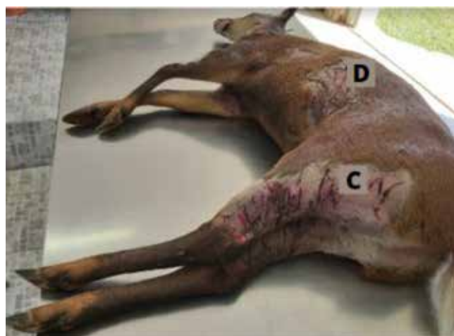
Figura 04 - Lesões múltiplas escarificantes e penetrantes em epitélio cutâneo em diferentes regiões características de dentes e garras de cães (C e D).

O animal apresentava lesões múltiplas escarificantes e penetrantes em epitélio cutâneo em diferentes regiões, lesões estas características de dentes e garras de cães principalmente na região caudal dos membros posteriores, indicando que este foi atacado por mais de um cão. (figura 4).