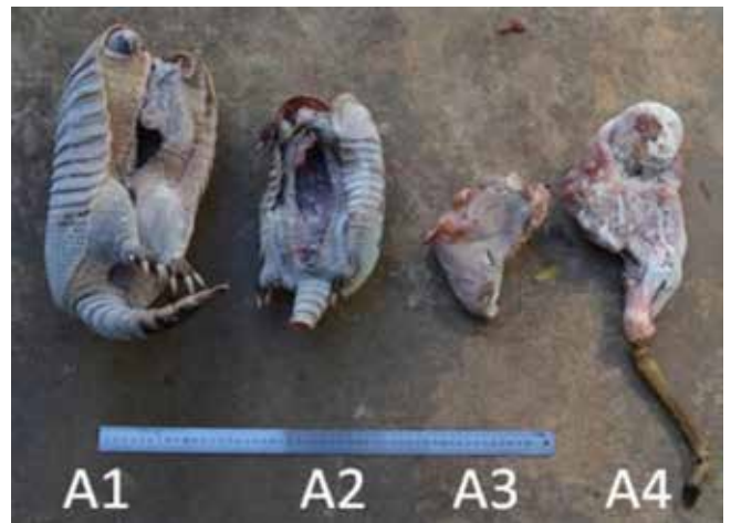
Figura 01 - Caso 1, fotos de animais/partes avaliados; à esquerda, vista dorsal ou externa; a direita, vista ventral ou interna.