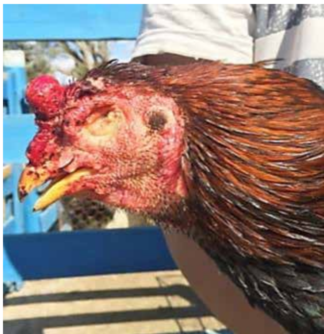
Figura 01 - Cegueira e cristas com processos cicatriciais.

No total dos oitenta e um galos apreendidos, vinte e seis (32,1%) foram ressocializados, vinte e nove (35,8%) vieram a óbito antes de serem inseridos no projeto (em virtude das más condições clínicas em que se encontravam), quatro (4,9%) não conseguiram se ressocializar e vinte e dois (27,16%) foram abatidos por decisão judicial, uma vez que na ocasião, não havia sido iniciado a ressocialização com a parceria da Unifor-MG e a Polícia Militar de Meio Ambiente.